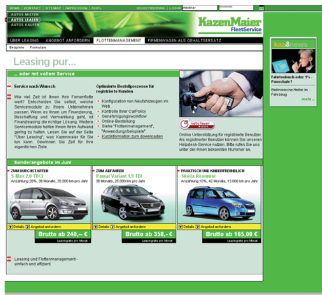
▲ Startseite des Kazenmaier Unternehmensportals

Zielsetzung des gesamten Projekts war es, durch schlanke Prozesse sowohl die eigene Administration, als auch die des Kunden zu entlasten. Durch zunehmende Personalisierung der Informationen sollte ein Zusatznutzen geboten werden, der die Kundenzufriedenheit und somit die Bindung der Kunden ans Unternehmen erhöht.